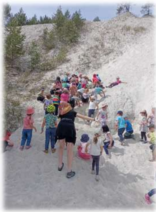
Školní výlet Farnapark u Toma, Plzeň