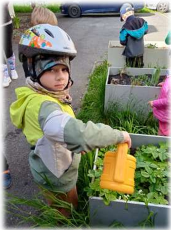
Účast na akcích pořádaných DDM Beroun. Péče o třídní záhonky – ekologická výchova.