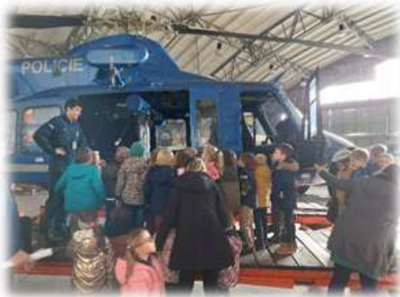
Exkurze – Hvězdárna Žebrák, Letecká služba Policie ČR Praha-Ruzyně