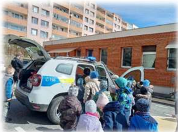
Vyhodnocení výtvarné soutěže pro rodiče a děti na téma „Letem světem v oblacích“ Preventivní program - beseda s Městskou Policií Beroun, ukázka služebního auta a jeho vybavení na dvoře MŠ.