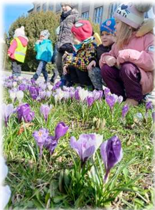
Vystoupení dětí na Náměstí J.Barranda. Pravidelné tematické ekovycházky.