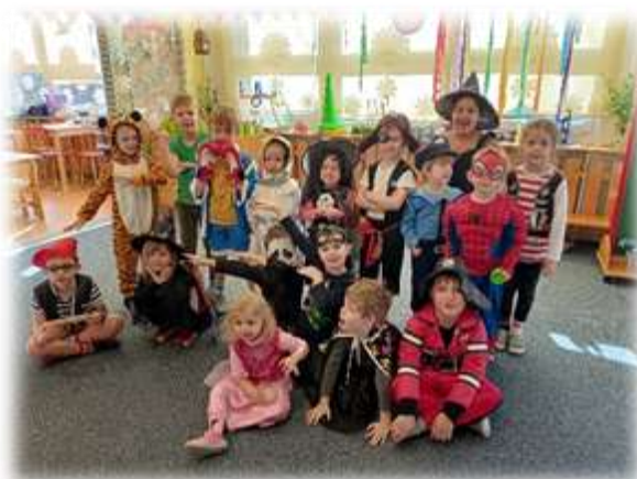
Divadelní a hudební představení. Karnevaly ve třídách.