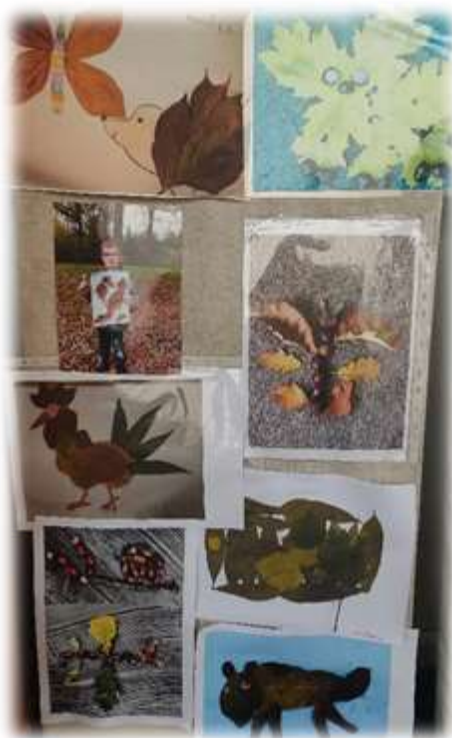
Podzimní pomoc s hrabáním zahrady. Ekoúkol pro rodiče a děti – obrázek z podzimních listů.