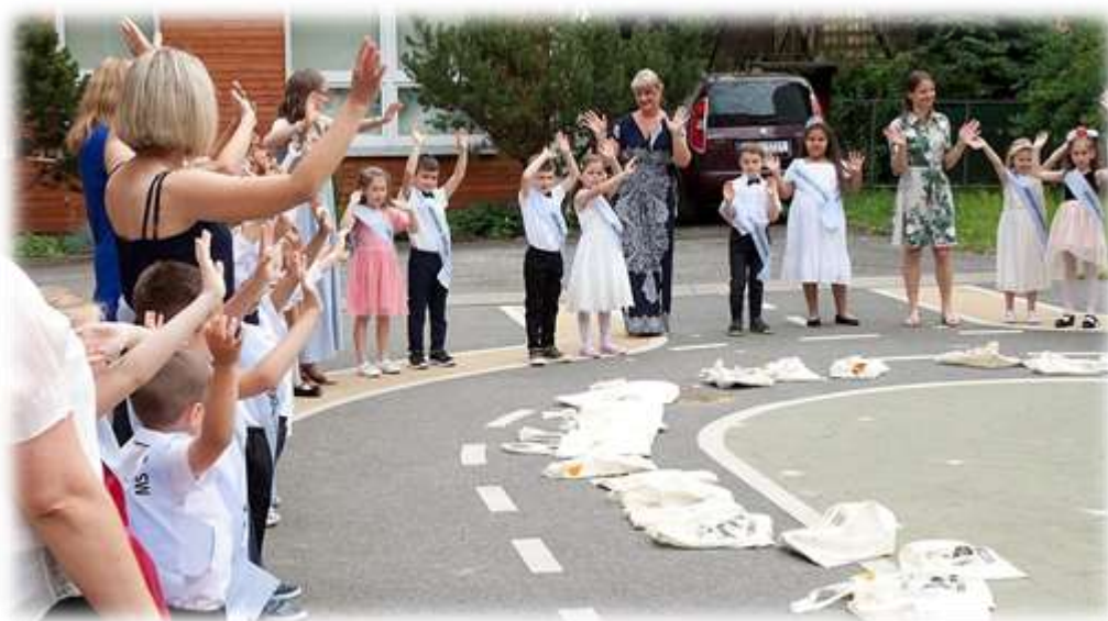
Slavnosti s rodiči na dvoře školky -Vánoční slavnost, Rozloučení s předškoláky.