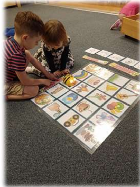
Digitalizace v MŠ - využívání digitálních hraček a zařízení v praxi.