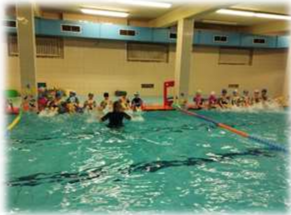
Škola v přírodě Čestice. Plavání předškoláků- Baby klub Hrošík.